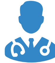
Regular Medical Check up