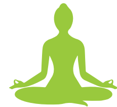
Anti Stress & Meditation