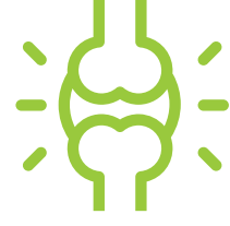
Anti Arthritis & Osteoporosis