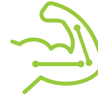
Strong Muscles & Bones